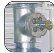
Ref. AA1190 Pressure relief valve Soupape limitatrice de vide Druckbegrenzungsventil