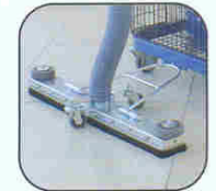
Ref. AA 1134 Fixed wet & dry tool for floor cleaning Suceur fixe poussières / liquides Nass und Trocken Festbodenreinigungsdüse