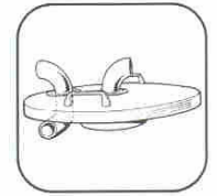
Ref. AA1077 Separator head Couvercle préseparateur Vorabscheider deckel