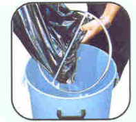
Ref. AA 1098 Fixing rings for disposable sacks Anneau de fixation pour sacs Ring für Sackabfestigung