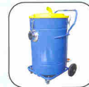
Ref. AA 1008 Wet & dry separator Séparateur poussières / liquides Nass und Trocken Vorabscheider