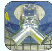
Ref. AA1152 2 or 3 ways suction inlet Bifurcations - trifurcations 2 - 3 Weg Sauganschluss