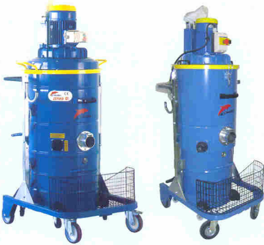
ZEFIRO 101 ZEFIRO 75