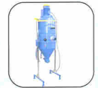
Special applications on request Applications spécifiques sur demande Sondergeräte nach Anfrage