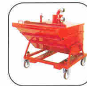
Ref. AA1009 Tilting 400 / 600 Lt. Separator Séparateur basculant 400 / 600 litres Trémies 400 / 600 Lt. Kippvorabscheider